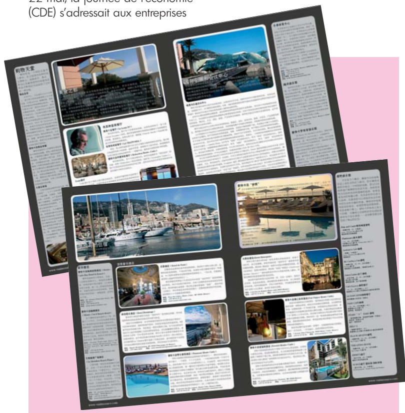
Magazine édité à 30 000 exemplaires