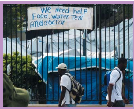
Camp de déplacés à Port-au-Prince

Repères Haïti - suite au séisme › 300.000 morts › 300.000 blessés › 1,7 millions de sans-abri