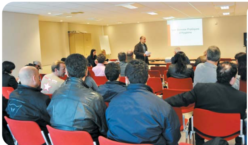
8 avril 2010 - Session de formation des professionnels de la Principauté

Cette présentation pédagogique a eu pour but d'expliquer la mise en œuvre sur le terrain des dispositions réglementaires mais égale-