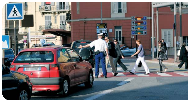
Régulation du trafic par la Police lors du Grand Prix de F1

La Sûreté Publique a été appuyée par quatre Compagnies