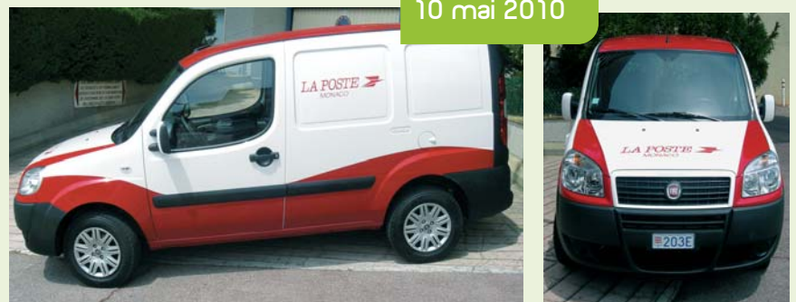
La Poste met en circulation deux nouveaux véhicules électriques colorisés en rouge et blanc