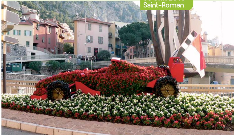
La Direction de l'Aménagement Urbain réalise une décoration florale avec plus d'un millier de bégonias rouge et blanc