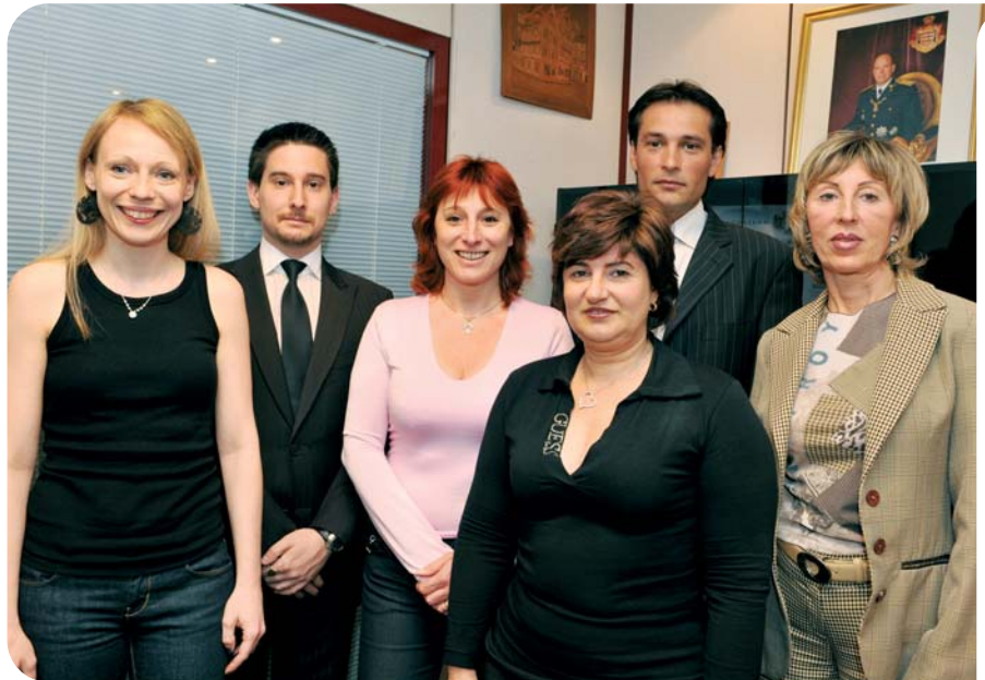
L'équipe de la Division des Enquêtes Économiques et Financières

Depuis 2008, la Division est également en charge du suivi du contrat