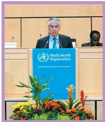
Discours de S.E. M. Franck Biancheri à la tribune de l'AMS le 18 mai 2010

Lors de son allocution le 18 mai dernier à la tribune de l'Assemblée, S.E. M. Franck Biancheri a souligné l'engagement de la Principauté en faveur des OMD, et notamment la politique monégasque en matière de coopération en faveur des pays les plus démunis : « ... la Principauté de Monaco développe prioritairement des programmes de coopération internationale qui visent à promouvoir l'autonomisation des femmes et la parité des sexes, dans les domaines de l'éducation, de la lutte contre la pauvreté de la santé maternelle et infantile ».