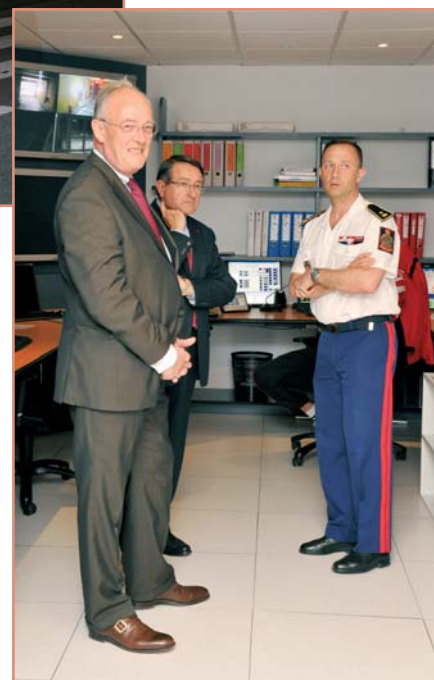
À la caserne des Sapeurs-Pompiers