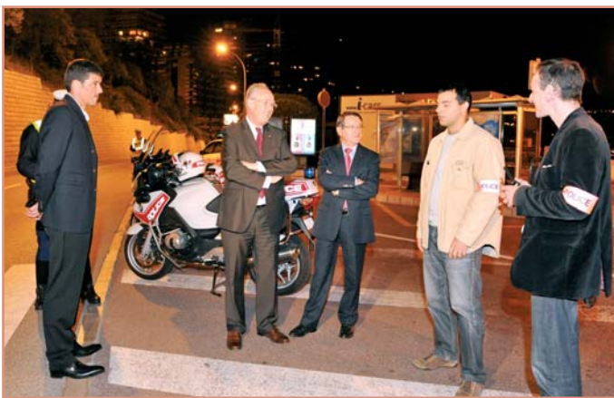
Avec la Direction de la Sûreté Publique

10/ En présence de Stéphane Valeri, S.E. M. Michel Roger a visité différents services du Centre Hospitalier Princesse Grace