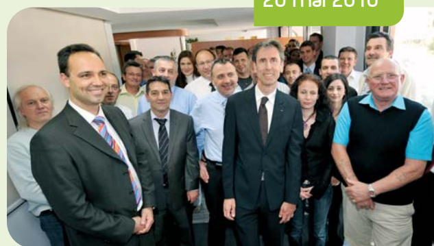
Une partie de l'équipe de la Direction de l'Aménagement Urbain lors de l'inauguration des nouveaux locaux de la Direction