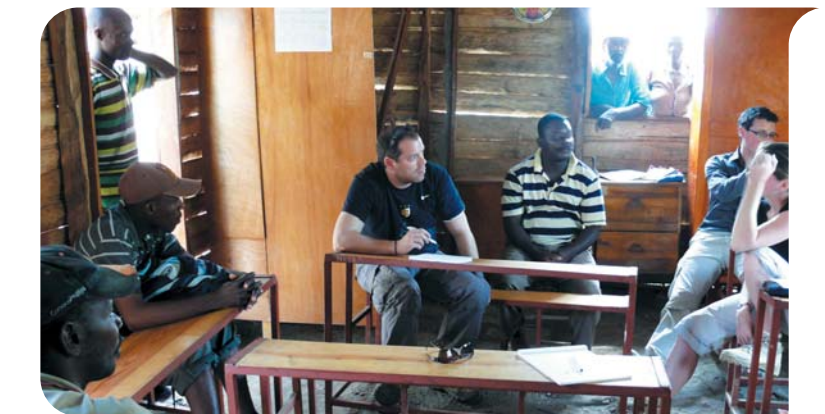
Rencontre de la délégation avec des interlocuteurs locaux (visite terrain)

Avant le séisme, son centre à Port au Prince accueillait 1.200 personnes par jour. Depuis le 12 janvier, il est devenu une véritable ville puisque quelque 6.000 à 8.000 personnes sont