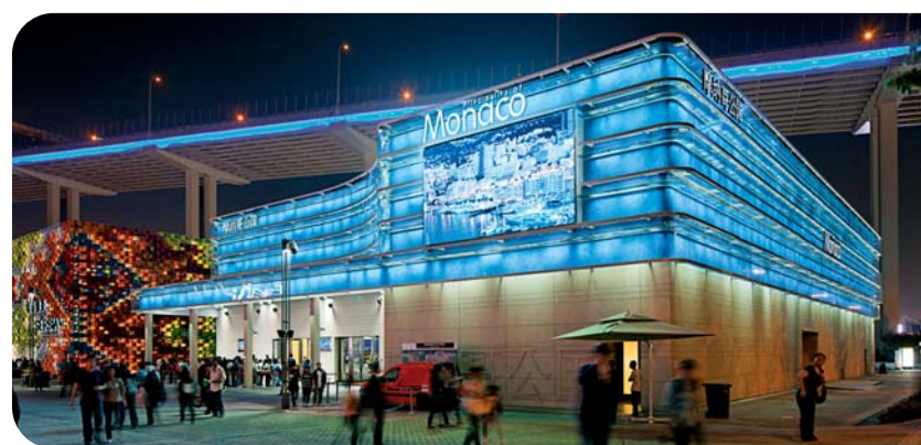
le Pavillon de Monaco à Shanghai